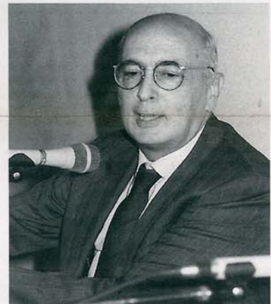
Il Ministro Giorgio Napolitano

sizione dei cittadini residenti nelle frazioni più lontane dal capoluogo, un servizio di autotrasporto straordinario da e per il Teatro Moderno. L'Amministrazione sta inoltre valutando la possibilità di far precedere la cerimonia vera e propria da un prologo, costituito dalla proiezione del combat-film realizzato due anni fa ad Argenta in occasione del 50° della Liberazione, e mai più proiettato in pubblico. L'opera, fra l'altro, è candidata ad un concorso cinematografico regionale. Inoltre, in questi giorni si sta accertando la possibilità di proporre un breve concerto di musica vocale, affidato alle Corali del nostro territorio.